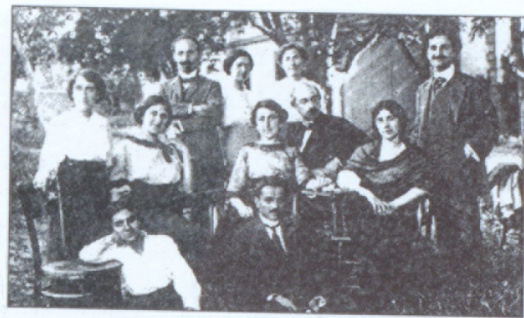
Տայեան վարժարանի սաները

սանների պատրաստման և հասունացման իւրօրինակ դպրոց: Այստեղ ձևաւորուեց դերասանական մի համաստեղութիւն, որոնցից շատերը մեծ հռչակ ձեռք բերեցին, իսկ Պետրոս Աղամեանն ու Սիրանոյշը հասան համաշխարհային համբաւի: