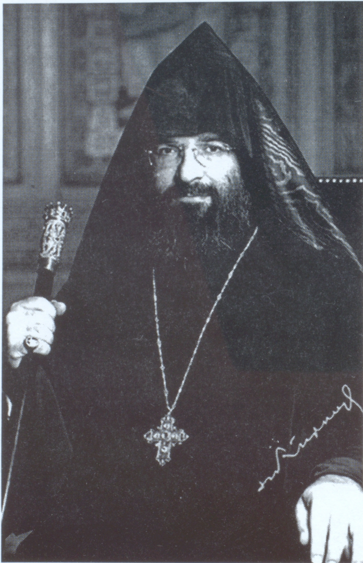
Ն. Ա. Տ. ՄԵՍՐՈՊ ԱՐՔ. ՄՈՒԹԱՖԵԱՆ ՊԱՏՐԻԱՐՔ ԹՈՒՐԿԻՅԵ ԼԱՅՈՑ

Կոստանդնուպոլսի հայ գաղութի պատմությունը սկիզբ է առնում Բիզանդական կայսրության կազմաւորման շրջանից: