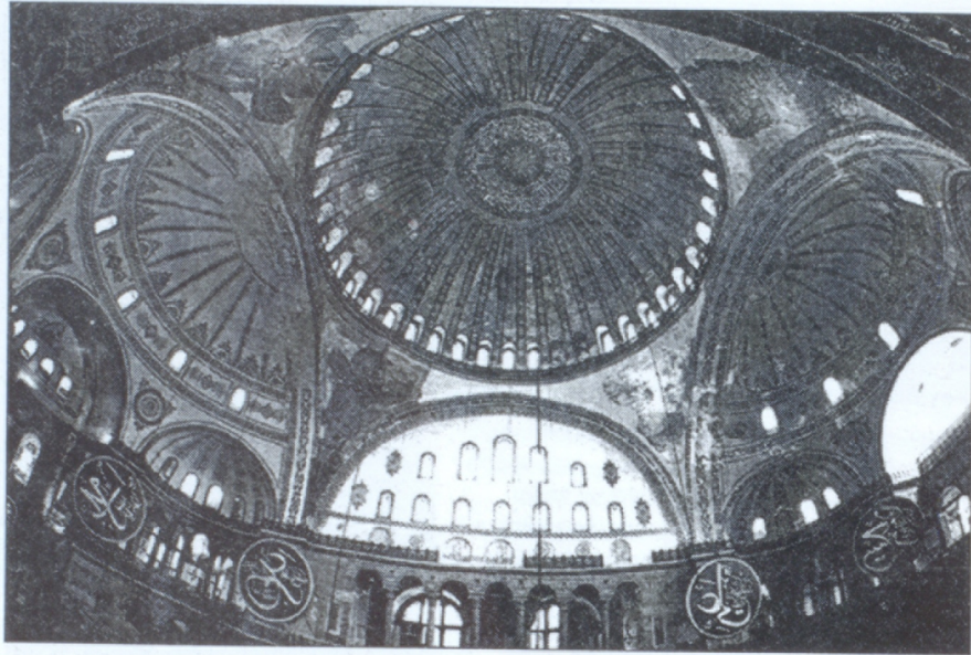
Ս. Սոֆիա տաճարի գմբեթը (989-992) Ճարտարապետ՝ Տրդատ

սկիզբը Կ.Պոլսում գործել են 350 մշակութային ընկերություններ: