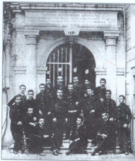
Կեդրոնական վարժարանի շրջանաւարտները (1891)