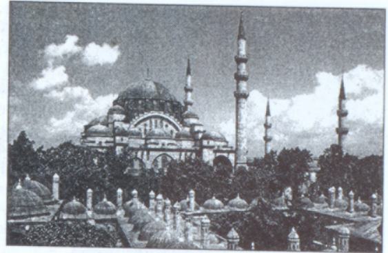
Սուլէյմանիէ մզկիթը (1550-1557) Ճարտարապետ՝ Սինան Մեծ