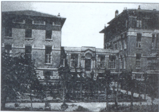
Ա. Փրկիչ Ազգային հիւանդանոցը

և հանրային կեանքին վերաբերող կանոնադրութիւնը, որը կոչոււմ էր Ազգային սահմանադրութիւն, 1860 թուականին ընդունեց Կ. Պոլսի Ազգային ժողովի կողմից: Սահմանադրութիւնը կարևոր էջ էր արևմտահայ հասարակական մտքի և քաղաքական պայքարի մէջ: