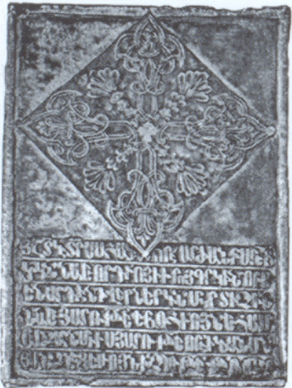
Խաչքար (1733) Ա. Գրիգոր Լուսաւորի եկեղեցում

Գրիգոր Օտեանի, Նահապետ Ռուսիանեանի, Սերովբէ Վիչէնեանի և Նիկողայոս Պալեանի մշակած ազգային, մշակութային