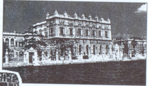
Դոլմաբախիշէ պալատը (1856) Ճարտարապետ՝ Կ. Պալեան

ռաջին հայ կոմպոզիտորն էր, որ մասնագիտական կրթութիւն է ստացել Եւրոպայում: Չոլխանեանը դարձաւ հայկական առաջին օպերաների և օպերետների, ոմանաների և գործիքային ստեղծագործութիւնների հեղինակը, երաժշտական առաջին թատրոնի հիմնադիրն ու կազմակերպիչը արևմտահայ իրականութեան մէջ՝ դնելով երաժշտական թատրոնի հիմքերը Թուրքիայում և ամբողջ Մերձատր Արևելքում: