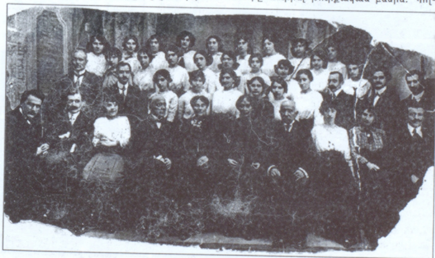
Դպրոցասիրաց Տիկնանց վարժարանի սաները (1914)

Քաղաքական աննպաստ պայմանները Կ.Պոլսի հայ թատրոնին ստիպեցին իր ուժերը նուիրել թուրքական բեմին: Պոլ-