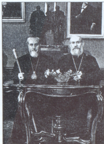
Վայգզէն Ա կաթողիկոսը և Ընրիք պատրիարքը Գրականութեան և արուեստի թանգարանում (1969)

Կ.Պոլսի մշակութային կեանքն աշխուժացաւ 1908 թ. Հիւրիլէթի հռչակումից յետոյ: Վերականգնուեցին հայկական դպրոցները, հրատարակչութիւնները, մշակութային ընկերութիւնները և միւս ազգային հաստատութիւնները և սկսեցին անելի արդիւնավէտ գործել: Թատերական կեանքն աշխուժացաւ Արելեան-Արմէնեան, Զարիֆեան-Սևումեան թատերախմբերի այցելութիւններով, Վահրամ Փափագեանի ելոյթներով: Կ.Պոլսի ե-