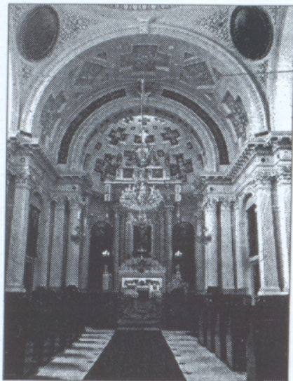
Պեշիկթաշի Ա. Աստուածածին եկեղեցին

«Ընդարձակ տարեցույց»ով: 1832 թուականին Յ. Պեզգենանի հիմնադրած այս հաստատությունը պոլսահայերի աջակցությամբ կատարելագործուեց ժամանակի գիտության և առողջապահության պահանջների համաձայն և գործում է մինչև այսօր: