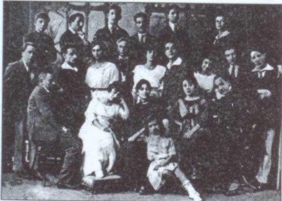
Պոլսի Դրամատիկ թատերախումբը (1919)

Պոլսոյ բարբառի հիման վրա ձևատրուեց գրական արևմտահայերէնը, որով ստեղծուեց արևմտահայ հարուստ գրականութիւնը (Յ. Պարոնեան, Պ. Դուրեան, Մ. Պէշկիթաշեան, Մշերենց, Տ. Կամսարական, Գ. Չոհրապ, Ե. Օտեան, Երուսիան, Մ. Չարիֆեան, Մ. Մեծարեանց, Սիամանթօ, Դ. Վարու-