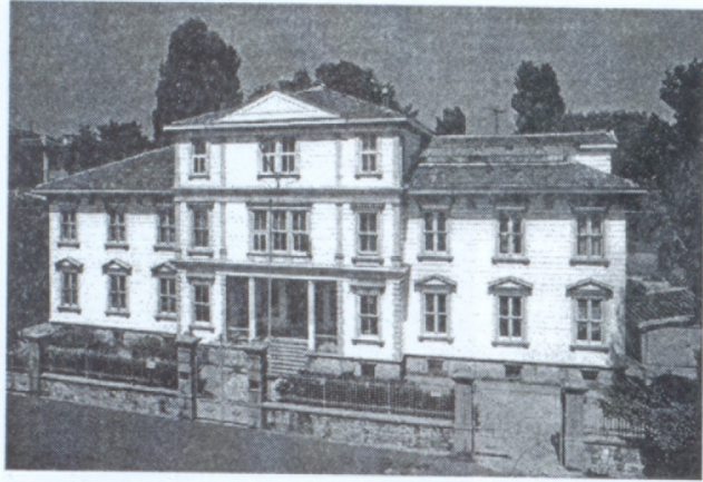
Թուրքիոյ Հայոց Պատրիարքարանի շէնքը Կ. Պոլսում

րադարձան Կ. Պոլիս, և կրկին ետուզեո սկսուեց մշակութային կեանքում: Սակայն Քէմալի կառավարութիւնը պոլսահայութեանը ստիպեց ապրել մահուան սարսափի մէջ, և շատերը հեռացան Կ. Պոլսից: