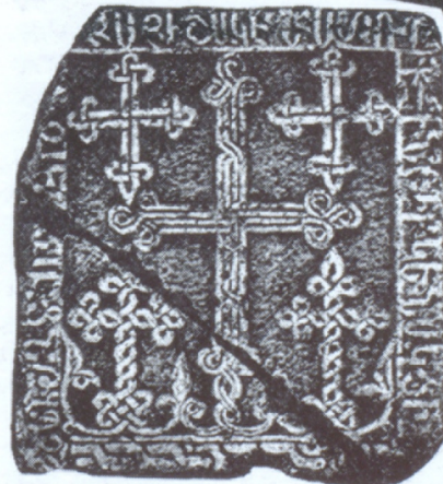
Խաչքար Ս. Գրիգոր Լուսաւորիչէ եկեղեցում

Պոլսահայ երգահանները հայ երաժշտարուեստը հարստացրին Ջէյթու-