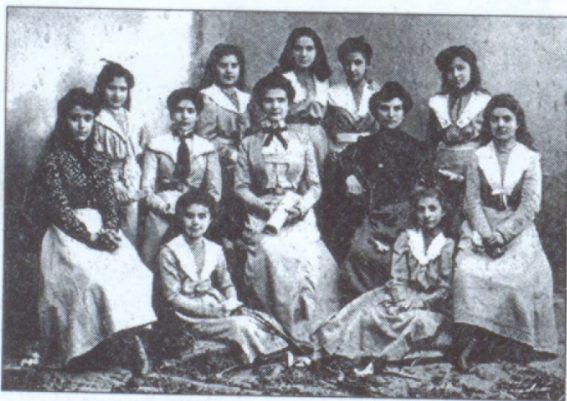
Լսայեան վարժարանի շրջանաւարտները (1903)

նեան երգաշարով, «Կիլիկիա», «Հայաստան, երկիր դրախտավայր», «Շղթայր ենք մեք», «Արիք Հայկազունք», «Օն մեր նախնի», «Գարուն», «Տէր կեցցո» և շատ ուրիշ