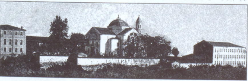
Արմաշի դպրեվանքը և Չարխափան Ա. Աստուածածին եկեղեցին