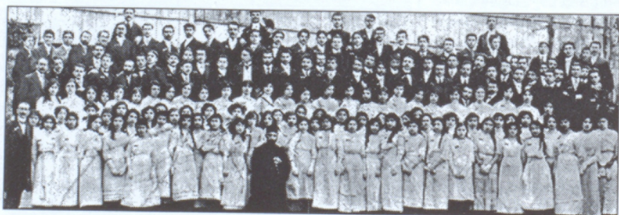
Կոմիտասի «Գուսան» երգչախումբը (1911)

րաններուն, մեր շիրմակոթողներուն, մեր գլխու փաթոցներուն, մեր գրպանի կիտուածագարդ ժամացոյցներուն վրայ, ամեն տեղ, ամեն բանի վրայ կը տեսնենք կնիքը անոնց արուեստագիտական տաղանդին», գրել է Թուրքիայի հանրապետութեան Լուսաւորութեան նախարար Համտուլլահ Սիւպհին: