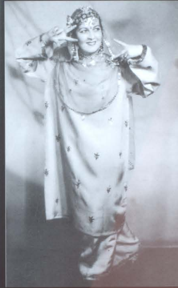
Պակիստանյան «Չազնազ» («Ասրդեր, սասրդեր»)

1975 թվականին կայացան Արև Բաղդասարյանի հյուրախաղերը Եգիպտոսի Արաբական Հանրապետությունում: Եվ վերստին աննախադեպ հաջողություն: Տեղի մամուլը նշում էր. «Համերգի ընթացքում հանդիսականների բազմահազարանոց լսարանը խլացուցիչ ծափերով էր ողջունում, նրան, որ մի քանի համար կատարեց միայն: Իսկ ինչ տեղի կունենար այն դեպքում, եթե նրա համերգը ներկայացվեր ամբողջությամբ, դժվար է երևակայել: