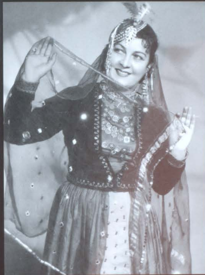
Իրանական «Գարնան շայնը»