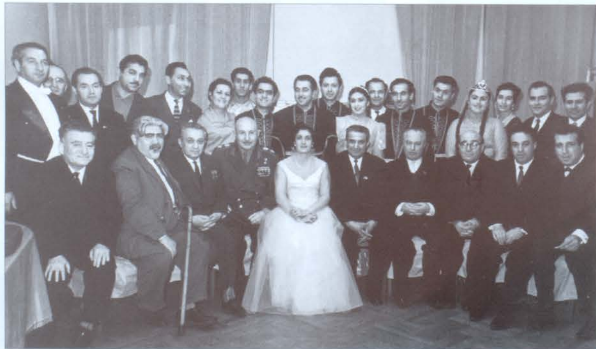
Մարշալ Բաղդասարյանը Հայաստանի գիյությունների և մշակույթի գործիչների հետ

Հետաքրքրական են նաև անկեղծ մակագրություններով լուսանկարները ի հիշատակ արտիստուհու հանդիպումների մարշալ Բաղդասարյանի, գեներալներ Սաֆարյանի և Մուրադյանի, Բելգոբուսկու և Դրագունսկու, Խորհրդային Միության կրկնակի հերոս Նելսոն Ստեփանյանի հետ, ինչպես նաև արտասահմանյան երկրների նշանավոր հասարակական ու պետական գործիչների հետ: