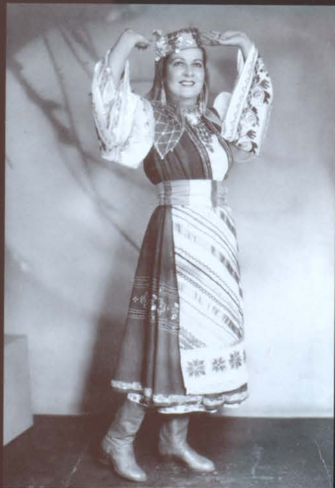
Բելոռուսական «Սիրելի մայրիկ»