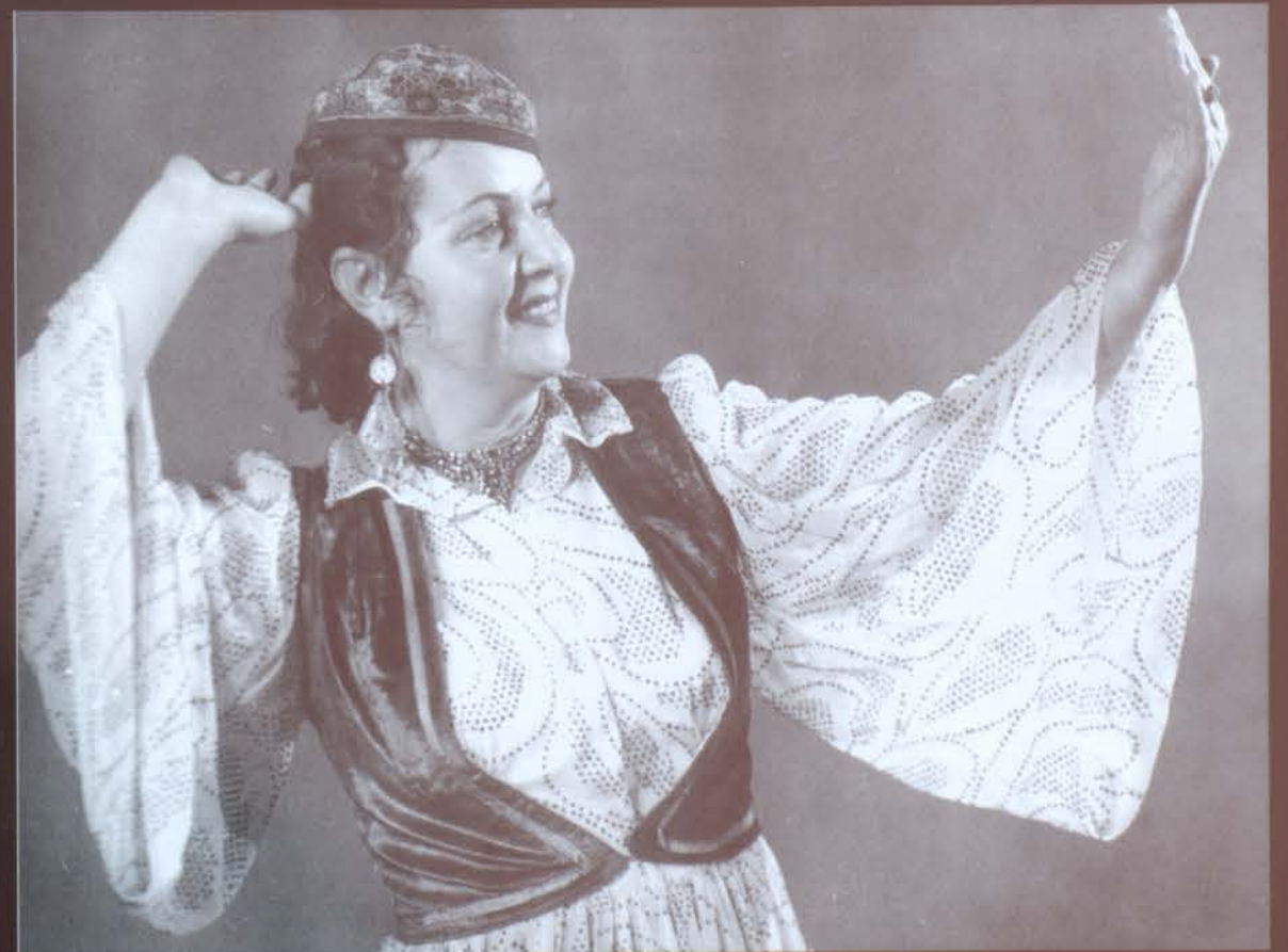
Ուզբեկական «Այ մայրիկ»