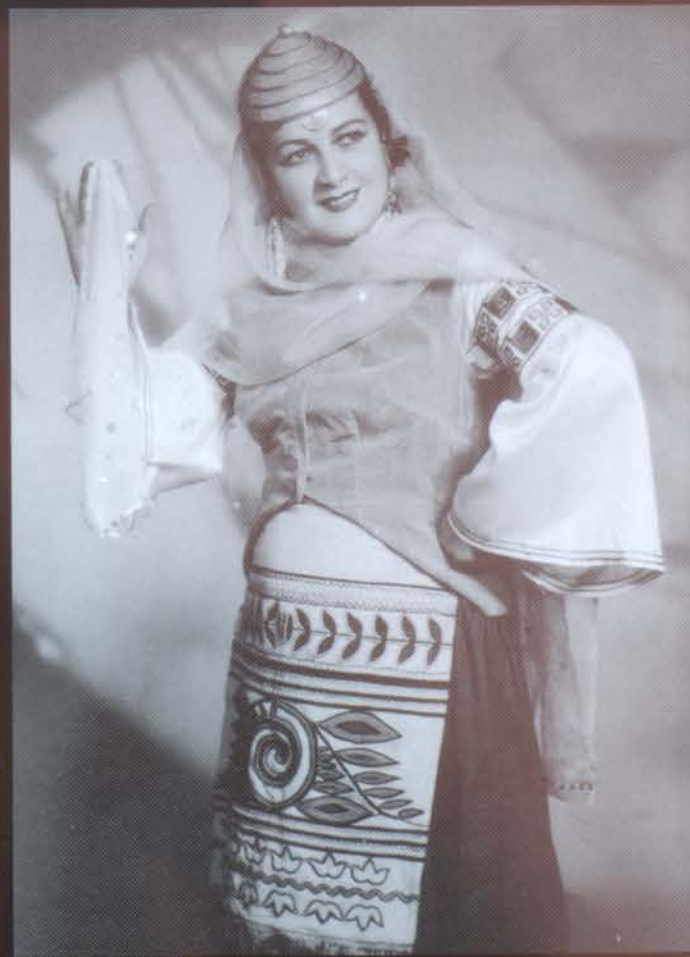
Հունական «Նինանայ յավրոն» («Արկազ պարենը իմ գեղեցկուհի»)