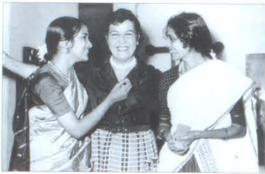
Համերգից հետո հնդիկ կոլեգաների հետ. Դեկտեմբեր (1964թ.)