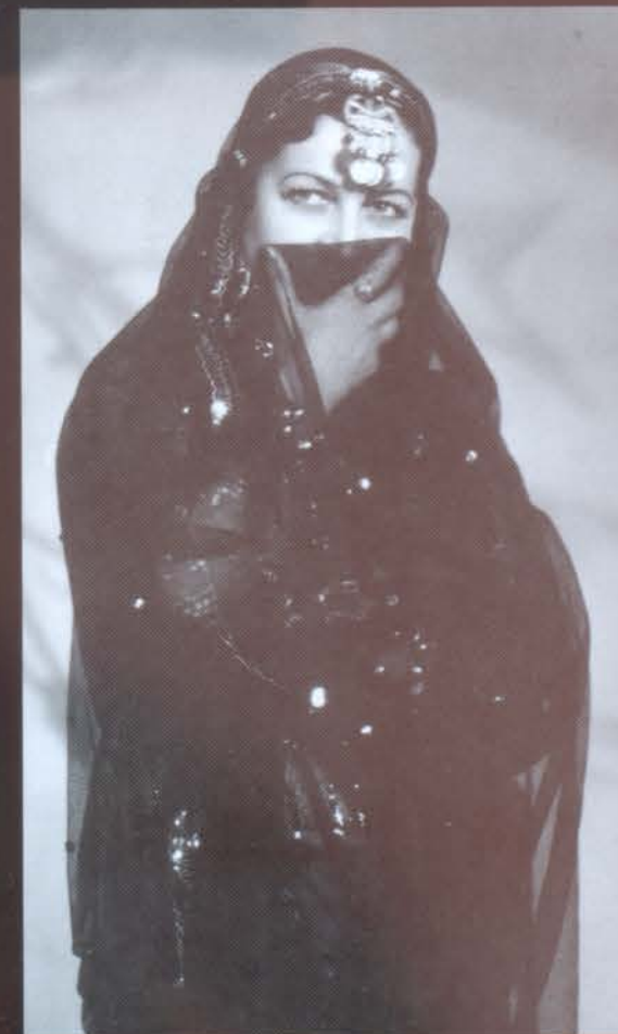
Արաբական «Գեղեցիկ աղջիկ»

Այս բոլոր ուղևորություններն արտացոլվեցին նրա խաղացանկում: Յուրաքանչյուր ուղևորությունից հետո նրա ծրագիրը հարստանում էր նոր համարներով, թարմություն հաղորդելով նրա արվեստին, հնարավորություն տալով նրա տաղանդին նորովի դրսևորվել: Ինչ երկիր էլ այցելեր, ամենուր նա հիացնում էր հանդիսատեսներին իր հմայքով, հոգեհմա հայկական երգով, հիանալի պարով՝ մերթ խրոխտ ու խանդավառ, բայց միշտ թովչանքով առլեցուն: