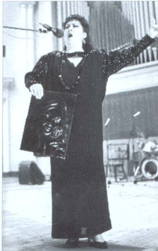
Արև Բաղդասարյանի հորեյանական երեկոյին էլույթ է ունենում արգենտինացի կինոաստղ Լոլիտա Թորեսը (1987թ.)

Տպավորիչ էր արգենտինացի կինոաստղ Լոլի-Տաա Թորեսի ելույթը: Արև Բաղդասարյանը նրա հետ ծանոթացել էր արտասահմանում կայացած համերգներից մեկի ժամանակ և երկար տարիների ընթացքում պահպանում էր բարեկամական կապեր: Հայաստանում Լոլիտա Թորեսի հյուրախաղերը զուգահեյակեցին Արև Բաղդասարյանի հորեյանական արարողությանը, և Արգենտինայից ժամանած անվանի հյուրը սիրով ներկայացավ իր հայ ընկերուհու ստեղծագործական երեկոյին՝ անձամբ շնորհավորելու նրան: Այդ երեկո, ներկաների բուռն ծափողջույնների ուղեկցությամբ Լ. Թորեսը հորեյանին նվիրեց իր երգերից մի քանի կատարումներ: