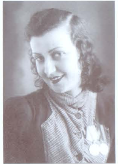
Հայկական երգ՝ «Աշուղ եմ»

Նրա անդրանիկ պրոֆեսիոնալ համերգը 1948 թվականին անցավ մեծ հաջողությամբ. այն բոլորովին նոր որակ էր, և շատերը նշեցին նրա ստեղծագործական կյանքում տեղի ունեցած դրական փոփոխությունը: